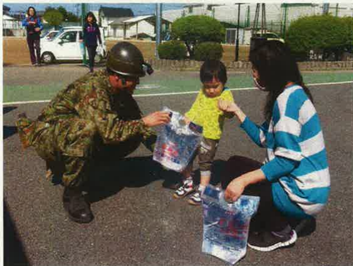
活動場所:菊池市立隈府小学校