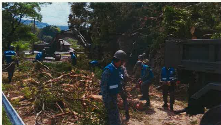
倒木除去の状況 (西原村)