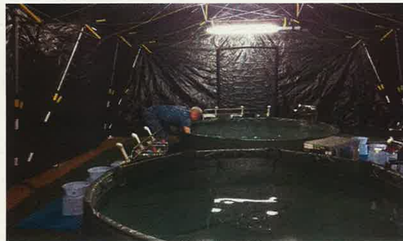
入浴支援の状況 (菊陽町)