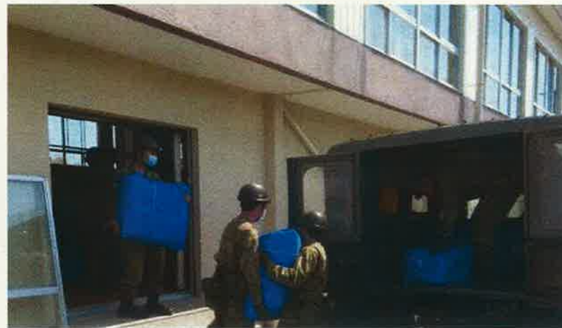
物資輸送の状況 (菊之池小学校)