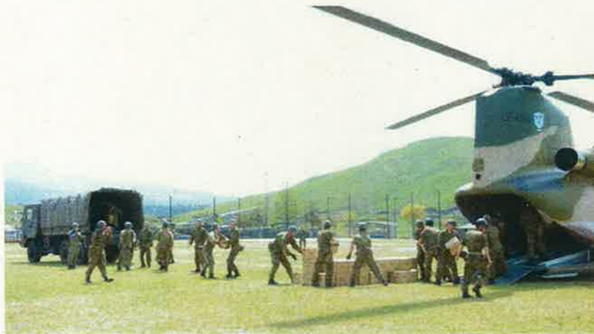
物資輸送の状況 (アピカ運動公園)