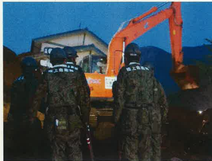
活動場所:熊本県南阿蘇村